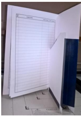
Фасцикла плус додатак фасцикли